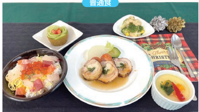
クリスマス料理(普通食の方を対象)

粥寿司、テリーヌ、洋風茶わん蒸し 粥寿司は、しっかりと寿司酢の味がして好評です。