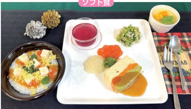
クリスマス料理(ソフト食の方を対象)

食材をミキサーにかけ、粒のないペースト状にしたものを専用の凝固剤にして固め、舌で押しつぶせる硬さにしたものです。